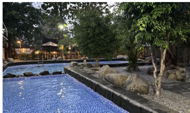
Gambar 3. Kolam modern berkeramik biru Umbul Kemanten dikelilingi bebatuan alam dan pepohonan rindang, menciptakan kontras estetik yang kuat (Dokumentasi lapangan, 2025)

Gambar 2 memperlihatkan suasana kolam alam Umbul Kemanten dengan karakteristik dasar berbatu dan air yang terlihat jernih kecokelatan—ciri khas mata air alami. Kehadiran pengunjung dari berbagai kelompok usia mengindikasikan daya tarik destinasi yang lintas demografis. Hal ini relevan dalam konteks promosi digital: konten yang menampilkan suasana nyata pengunjung (bukan foto destinasi kosong) lebih efektif membangun social proof bagi calon wisatawan baru.