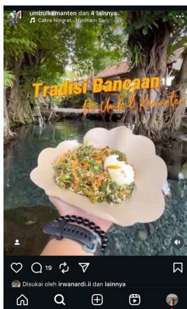
Gambar 4. Konten promosi Instagram Umbul Kemanten yang menampilkan Tradisi Bancaan—ritual budaya Jawa yang diselenggarakan setiap Jumat Kliwon—sebagai elemen Interest dalam kerangka AIDA

Setelah perhatian berhasil ditangkap, konten yang efektif harus mampu mengonversi perhatian tersebut menjadi minat yang berkelanjutan. Pada Umbul Kemanten, tahap Interest dibangun melalui strategi content layering—penggabungan informasi faktual tentang destinasi dengan narasi emosional yang membangkitkan rasa ingin tahu.