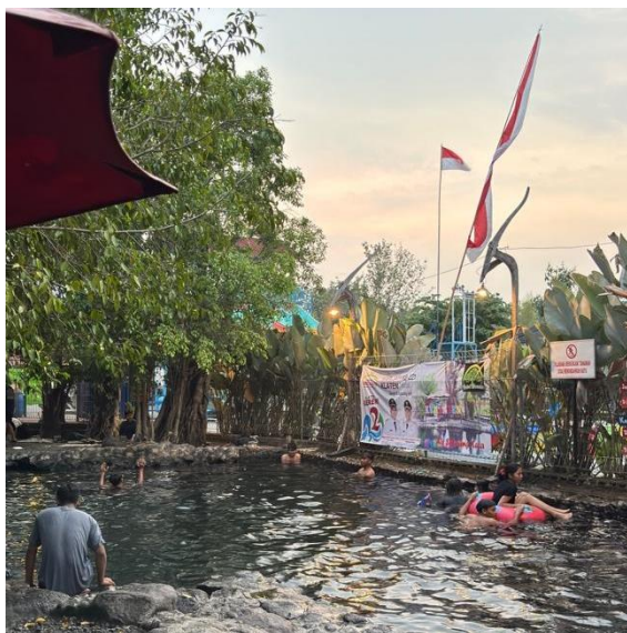
Gambar 1. Kolam alam Umbul Kemanten dengan pengunjung dan spanduk HUT Klaten, menampilkan suasana destinasi yang ramai dan autentik (Dokumentasi lapangan, 2025)

Umbul Kemanten merupakan salah satu destinasi wisata air yang berlokasi di Desa Sidowayah, Kecamatan Polanharjo, Kabupaten Klaten, Jawa Tengah. Destinasi ini dikelola oleh BUMDes Sinergis Sidowayah dan menawarkan dua kolam utama: kolam alam berbatu yang mempertahankan suasana orisinal sumber air, dan kolam modern berkeramik biru yang dilengkapi berbagai fasilitas. Selain nilai ekologis, Umbul Kemanten memiliki dimensi kultural yang khas - cerita rakyat romantis tentang 'umbul' (mata air) yang menjadi saksi cinta sepasang pengantin (kemanten) - sebuah narasi yang memberikan identitas unik sekaligus nilai emosional yang tinggi bagi destinasi ini.