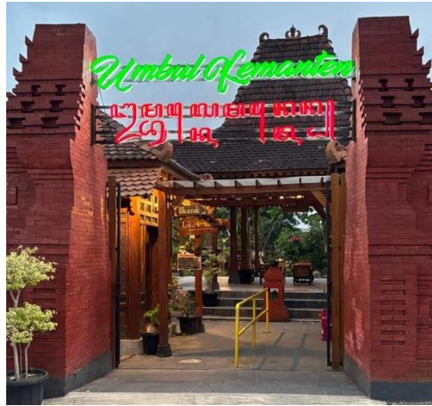
Gambar 2. Gerbang masuk Umbul Kemanten bergaya candi Jawa dengan ornamen merah-bata yang khas dan instagrammable (Dokumentasi lapangan, 2025)

Umbul Kemanten merupakan destinasi wisata air yang berlokasi di Desa Sidowayah, Kecamatan Polanharjo, Kabupaten Klaten, Jawa Tengah, dan dikelola oleh BUMDes Sinergis Sidowayah. Destinasi ini menawarkan dua zona utama yang saling melengkapi: zona kolam alam dengan dasar bebatuan yang mempertahankan suasana orisinal sumber mata air, dan zona kolam modern berkeramik biru yang dilengkapi fasilitas pendukung.