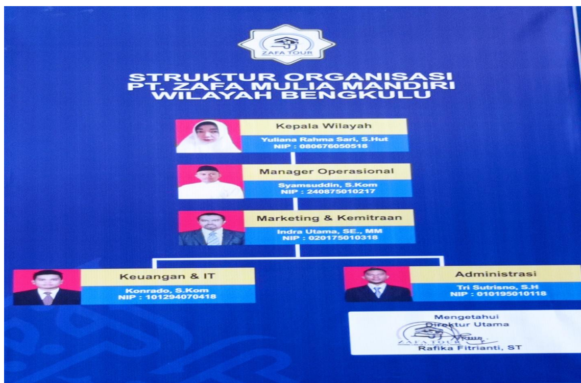
Gambar 1. Struktur Organisasi PT. Zafa Mulia Mandiri Wilayah Bengkulu

Tingginya tingkat kepercayaan jemaah menjadi acuan untuk selalu memberikan pelayanan yang terbaik dan maksimal. Zafa Tour memiliki slogan “Umrah Hemat, Kualitas Hebat”. Slogan ini sejalan dengan harga yang relatif terjangkau yakni mulai dari 24 sampai 32 juta rupiah pada masa sebelum COVID-19. Namun setelah terjadinya pandemi COVID-19, harga paket menyesuaikan dengan kebijakan pemerintah yakni mengalami kenaikan sekitar 30%.